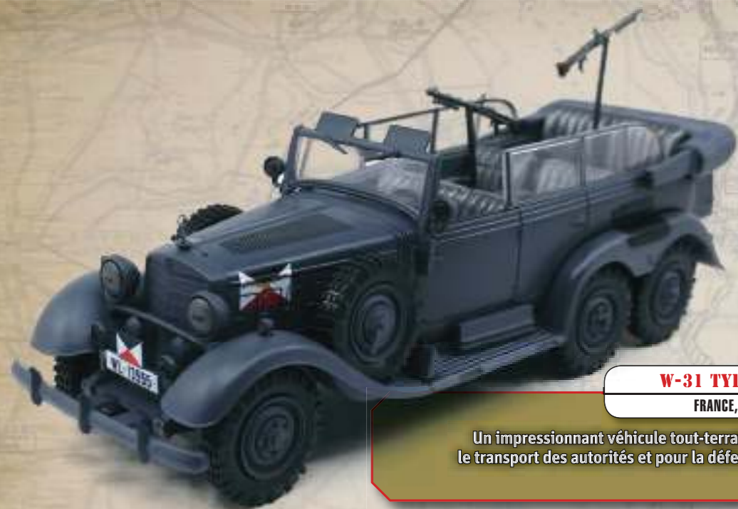
W-31 TYP 64-540 FRANCE, 1940

Un impressionnant véhicule tout-terrain qui a servi pour le transport des autorités et pour la défense antiaérienne.