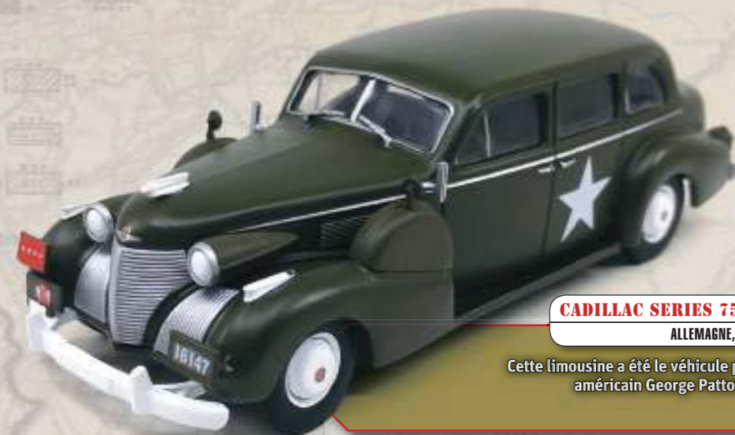
CADILLAC SERIES 75 FLEETWOOD V8 ALLEMAGNE, 1945

Un impressionnant véhicule tout-terrain qui a servi pour le transport des autorités et pour la défense antiaérienne.