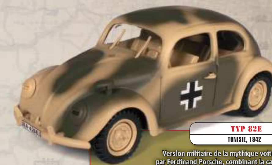
TYP 82E TUNISIE, 1942

Véhicule tout-terrain à traction intégrale et roues pivotantes sur les essieux avant et arrière, commandé par l'armée allemande avant la guerre.