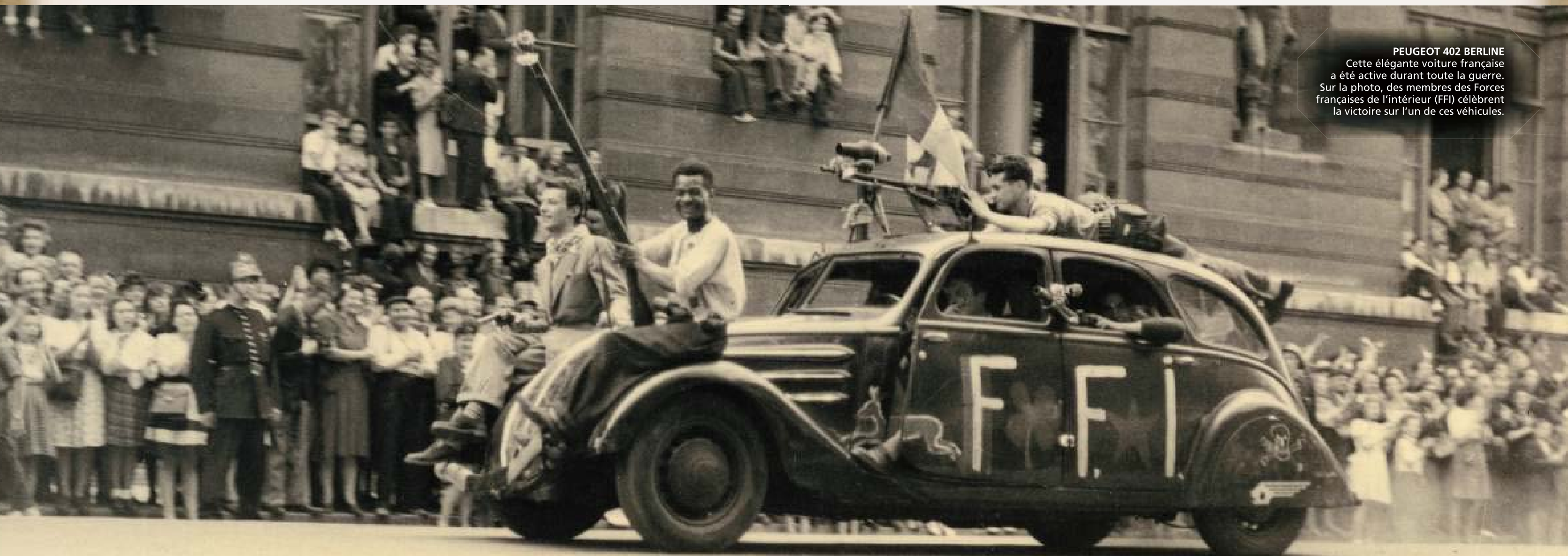
PEUGEOT 402 BERLINE Cette élégante voiture française a été active durant toute la guerre. Sur la photo, des membres des Forces françaises de l'intérieur (FFI) célèbrent la victoire sur l'un de ces véhicules.

Dans cette passionnante collection, vous découvrirez les caractéristiques techniques des véhicules et en apprendrez plus sur leur évolution et le rôle qu'ils ont joué pendant la Seconde Guerre mondiale.