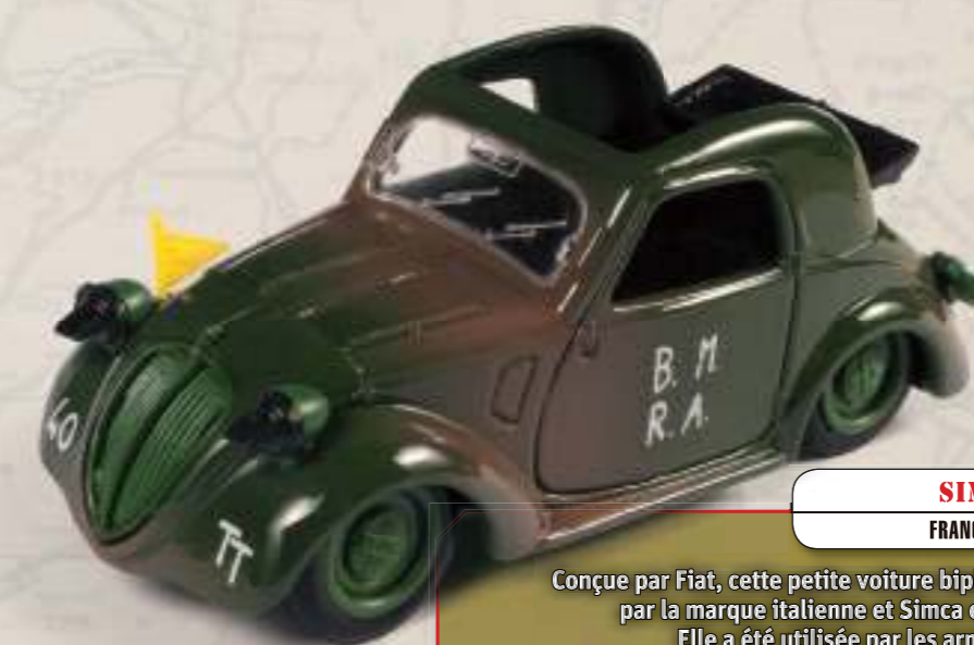
SIMCA 5 FRANCE, 1940

Construite entre 1934 et 1938, cette voiture de tourisme a également été utilisée par l'armée française pour moderniser ses unités motorisées.