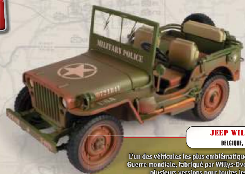
JEEP WILLYS MB BELGIQUE, 1944

Cette petite voiture à moteur refroidi par air et à traction arrière est devenue très populaire sur tous les fronts grâce à sa fiabilité légendaire.