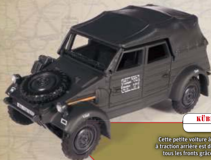
KÜBELWAGEN TYP 82 ITALIE, 1943

Cette petite voiture à moteur refroidi par air et à traction arrière est devenue très populaire sur tous les fronts grâce à sa fiabilité légendaire.