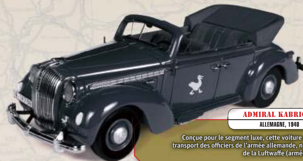
ADMIRAL KABRIOLET ALLEMAGNE, 1940

Cette limousine a été le véhicule personnel du général américain George Patton durant les derniers mois de la guerre.