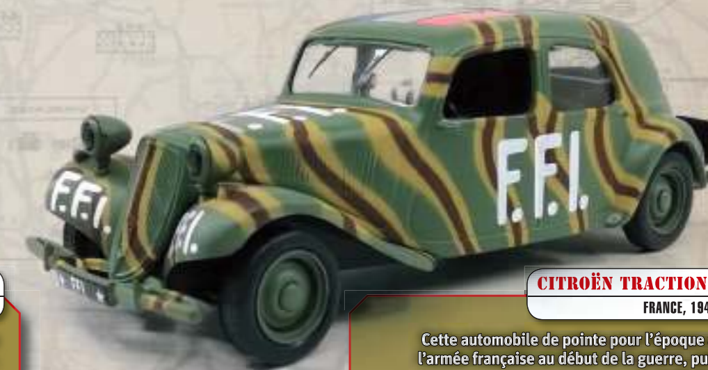
CITROËN TRACTION AVANT II BL FRANCE, 1944

Conçue par Fiat, cette petite voiture biplace a été fabriquée par la marque italienne et Simca entre 1936 et 1949. Elle a été utilisée par les armées des deux pays.