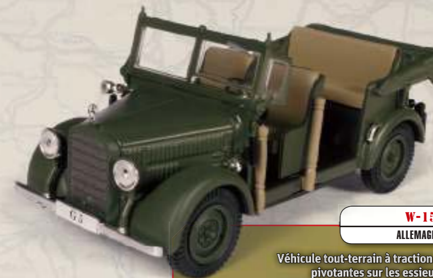
W-152 G5 ALLEMAGNE, 1939

Conçue pour le segment luxe, cette voiture servait au transport des officiers de l'armée allemande, notamment de la Luftwaffe (armée de l'air).