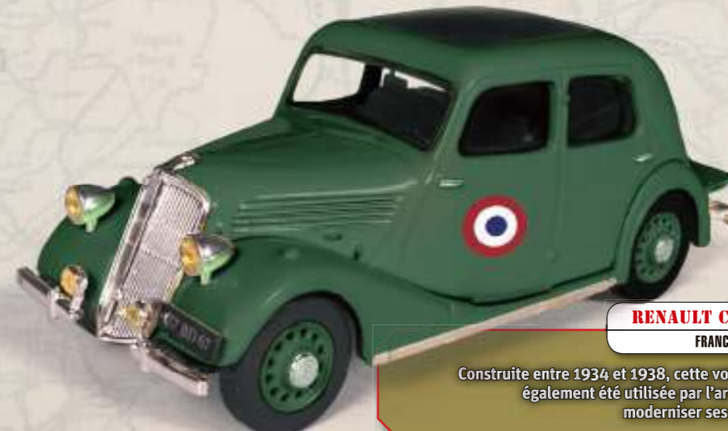
RENAULT CELTAQUATRE FRANCE, 1940

L'un des véhicules les plus emblématiques de la Seconde Guerre mondiale, fabriqué par Willys-Overland et Ford en plusieurs versions pour toutes les armées alliées.